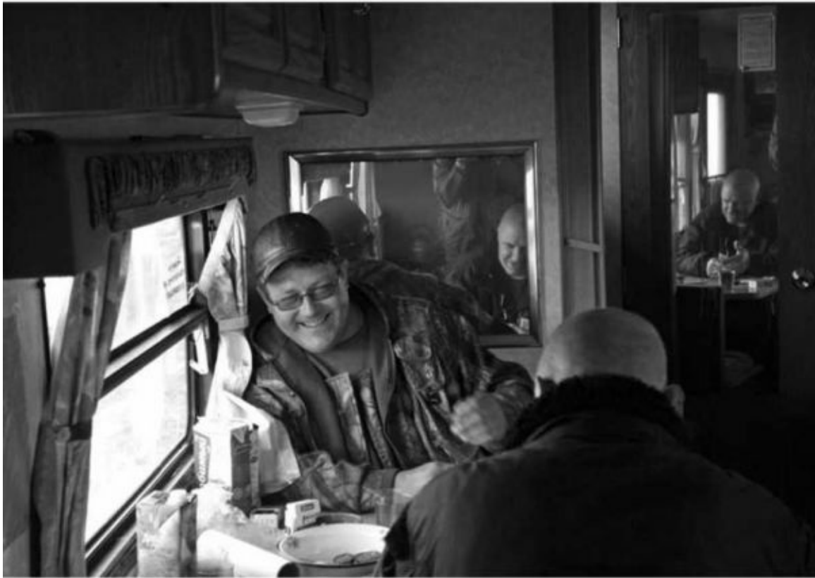
Czekista Dima i Wania błatnik rzną w durnia