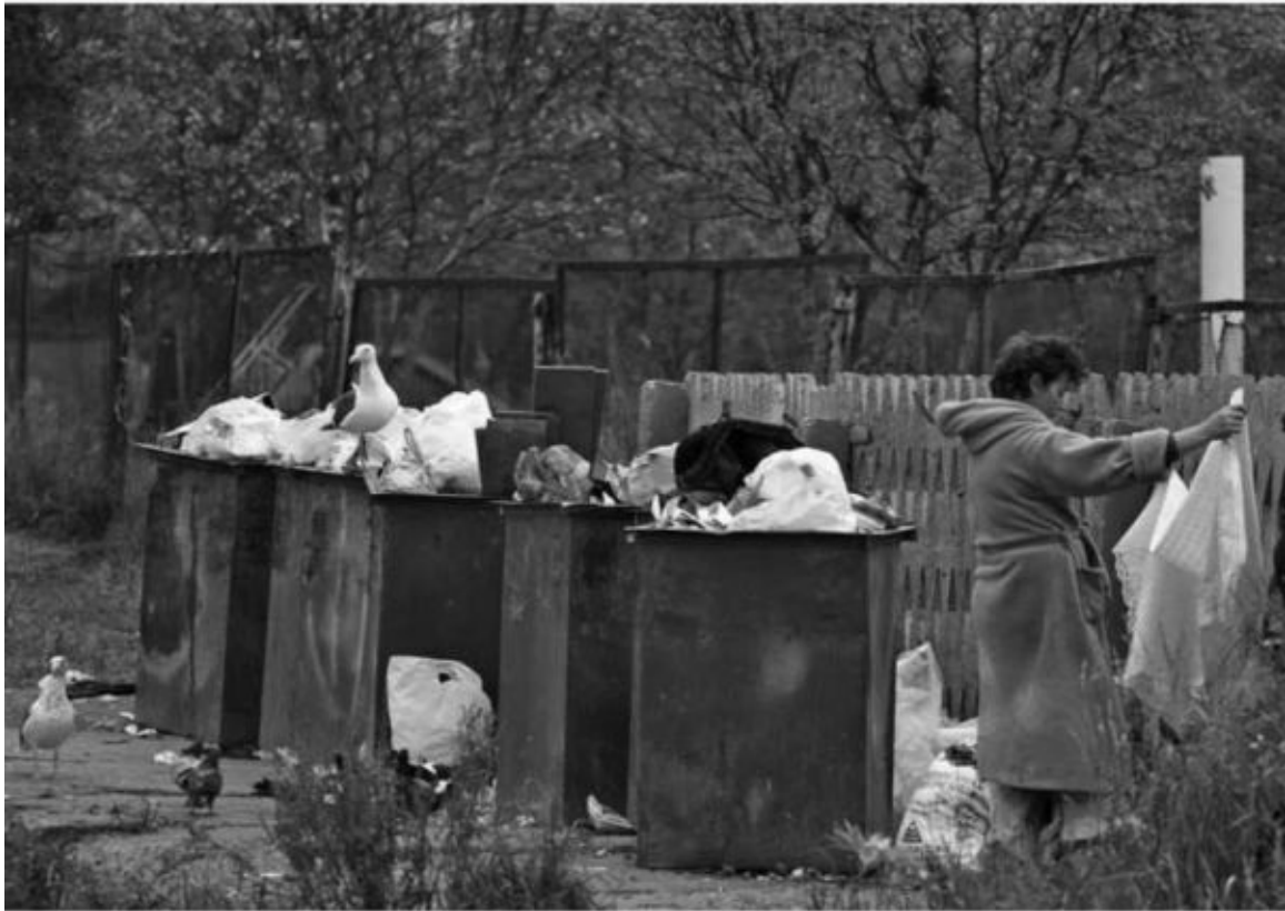
Magadan. Połowa września. Na wzgórzach wokół miasta już leży śnieg